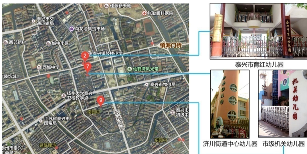
图 2 泰兴市老城区 600 米街道有 3 所省优园