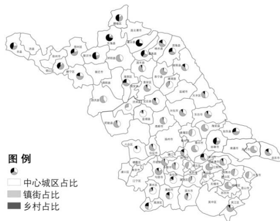
图 1 2016 江苏省各区县幼儿选择中心城区、镇街、乡村入园占比示意

区的幼儿园（原被撤并乡镇的幼儿园）和城乡结合部幼儿园生源流失严重，生源减少使得这些幼儿园运营难以为继，例如扬州市中心城区外围乡镇幼儿千人指标明显低于中心城区，平均每一千人中只有 14~15 个幼儿。在经济欠发达地区，幼儿园建设滞后，例如盐城响水县公办园较少，大量无证园随处可见，安全隐患突出。苏北很多乡镇仍然没有一所像样的乡镇中心幼儿园，仍然有大量依托乡镇中心小学的附属园。从新老城区角度来看，学前教育资源分布极为不均衡，老城区学前教育资源往往过于密集，新城区幼儿园布点匮乏。例如，泰兴老城区 600 米街道上有 3 所省优公办园，而新城区幼儿园极为缺乏，无法满足儿童入园需求。再如，淮阴新城 16 个小区仅配建 1 所公办幼儿园以及由售楼中心改造的 1 所民办园，入园难引发了群体性事件。