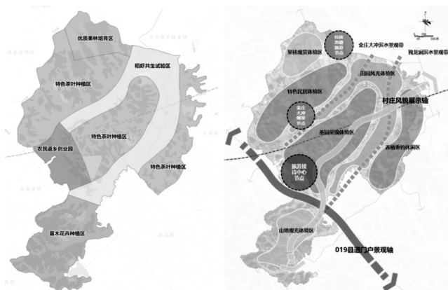
图3 太安村产业布局图(一园、四区)

农村产业的发展得力于产业发展的实施主体。目前,太安村产业发展实施主体主要为能人大户、家庭农场、集体经济合作社和涉农企业等。党委政府和村两委,要制定帮扶措施,加大涉农资金支持力度,激发