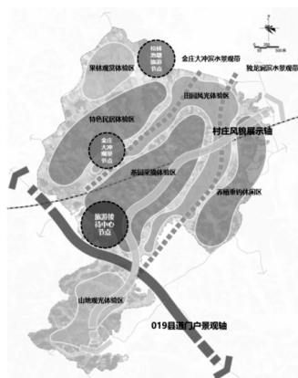
图4 太安村乡村旅游发展结构图