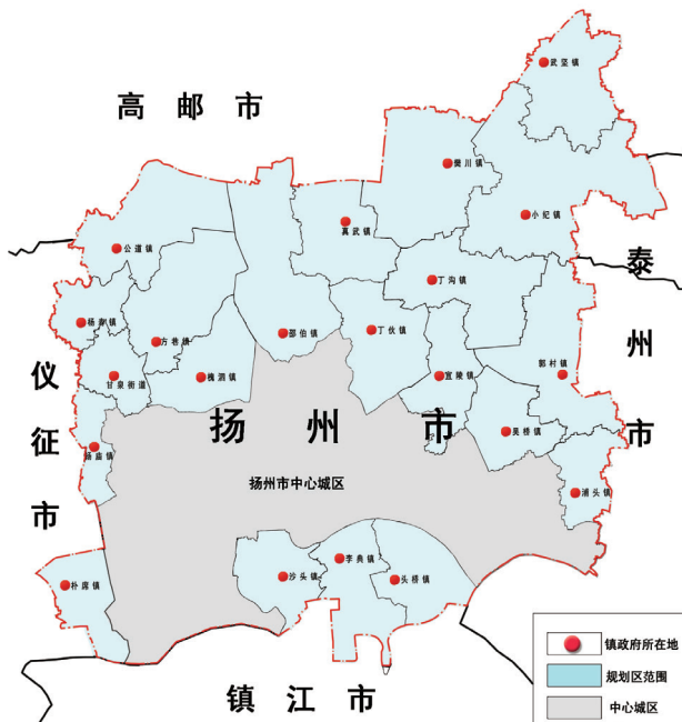
图1 扬州市规划区范围

扬州市位于江苏省中部、长江北沿岸。作为长三角核心区北翼中心城市，扬州市区位条件优越，经济基础扎实，镇村发展态势良好。《扬州市市区镇村布局规划》的规划范围为《扬州市城市总体规划(2011-2020)》确定的规划区范围内、中心城区外围地区的21个镇(街道)(图1)，共涉及到326个行政村，5492个自然村庄。规划区内村庄数量庞大，布局离散而不均质。此外，规划区内地理环境多样，不同地形地貌下形成的村庄空间呈现出不同特征，区域差异明显。