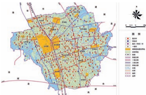
图5 宝应县村庄布局规划图

村庄管理的小微型特征，以及村庄建设用地性质的相对单一，在进行“多规合一”实操中有天然的便利性和可行性。但面对城镇各部门之间长期形成的各部门管理标准不统一现状，以及相对复杂的建设用地性质，如何运用