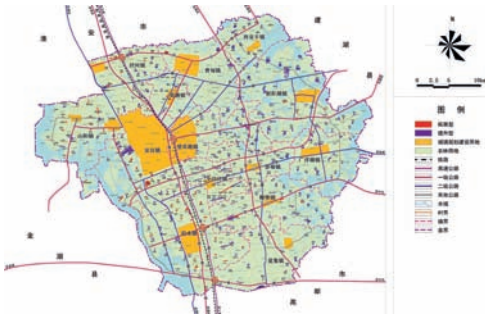
图6 宝应县村庄建设指引图