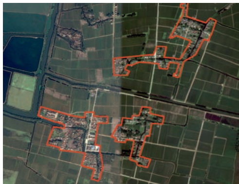
图3 团块状分布的村庄