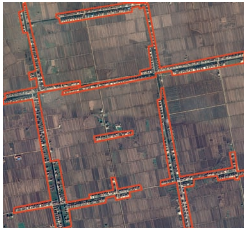
图4 条带状分布的村庄