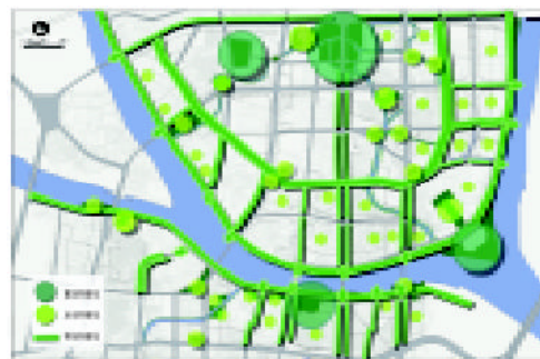
图 3 绿网

[摘要] 黄岐镇一河两岸区段的规划以“三网联江”构筑亲水空间, 保护具有岭南风格与西洋形式相结合的民居建筑, 建设商业、休闲区域, 分别对新村和旧村进行改造, 提出“叠合城市”的规划构想, 力图拯救失落的地区特色。