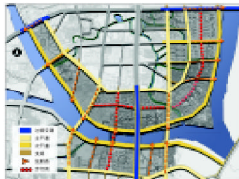
图 2 路网