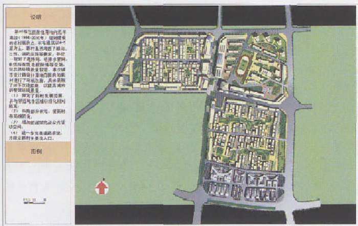
图8 新村改造总平面图