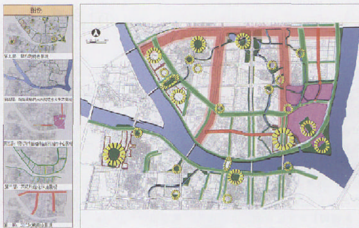
图9 “叠合城市”的分层规划设计

神层面的分层研究及设计，并将研究所涉及到的层面尽可能地结合起来，使城市这一巨构空间产生丰富的空间景观个性。