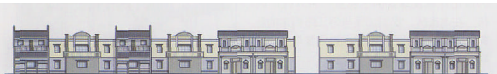
图5 商业步行街立面示意图