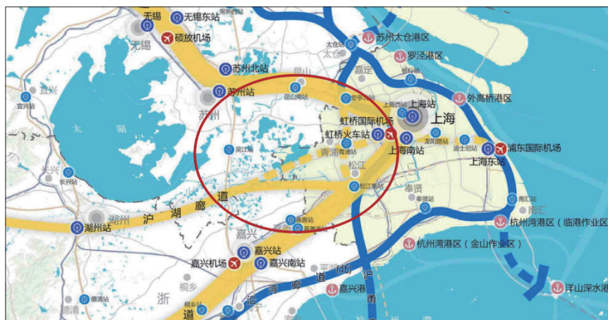
图3 空间一体化大方案区位示意图