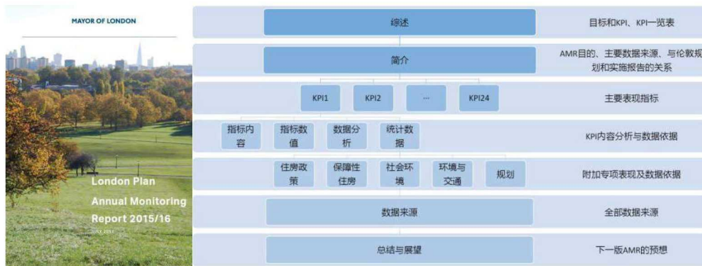
图2 伦敦规划年度监测报告主要内容框架

自2004年以来，大伦敦市政府层面以及各个郡的区政府层面针对大伦敦规划及地方发展规划开始编制年度监测报告（Annual Monitoring Report）（见图2），严格对应规划目标反映政策实施的绩效，次年一季度发布前一年的数据。在整体的规划实施体系中，伦敦的年度监测报告不仅要反映大伦敦规划、战略规划、地方发展规划中较长远的政策目标，同时要起到对实施规划、补充规划导则等行动计划的指导作用。