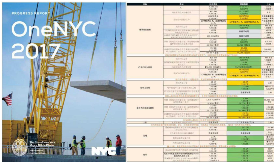
图 3 纽约 OneNYK 年度进展报告主要监测指标

2015 年纽约市发布了战略发展规划《一个纽约——规划一个强大而公正的城市》，为更好地贯彻实施“纽约战略规划”，纽约市市长办公室成立了专门负责编制与评价该规划的下属分支机构——“纽约市远期规划和可持续发展办公室”（the Mayor’s Office of Long-Term Planning and Sustainability, OLTPS），该办公室通过与其他相关部门与组织合作，对“纽约战略规划”进行跟踪、协调、完善式的监测评价。纽约每年出版发布年度进展报告（见图 3），对一年来目标的进展情况、指标的变化情况以及具体目标的实施明细与计划进展进行评估，并在此基础上将定期评估和规划修改同市长任期结合起来，每四年进行一轮综合回顾和反馈，为下一任市长进行全市战略调整提供依据。