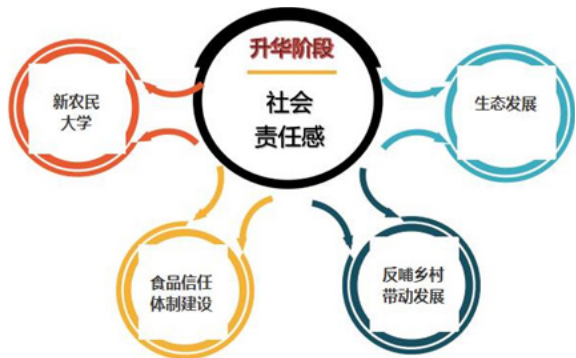
图3 升华阶段发展示意图

在升华阶段中，农业产业园更注重产业园的社会责任感，注重输出文化和理念，追求自身的发展对整个领域乃至整个社会进步的推动作用（见图3）。农业产业园建立园区“新农民大学”，向外输出健康饮食、健康生活的公共理念，参与构建食品信任体制；输出生态发展观念和可持续发展理念，推动现代农业的建设，并做到协同发展科、教、文事业，建立适应高效生态发展的盈利模式，实现生态文明、农业文明相互促进 [8] 。