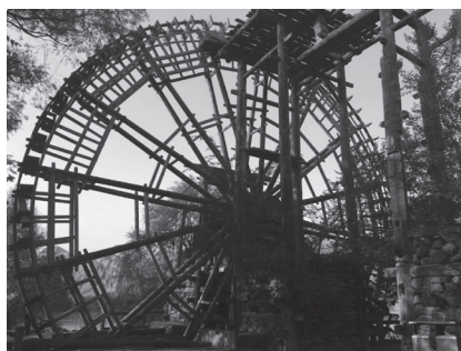
图 1 下川村水车

馆或旅游景点中看到水车悠然转动的身影。对于年轻人，它是陌生的、好奇的。对于老者，它是饱经沧桑的生活印记。对于研究者来说，它是历史的、神秘的，可以协助他们探寻古老农耕文明的渊源。对于素来认为“民以食为天”的中国劳动人民来说，对水车有深厚的感恩之情的，同时也不再仅仅是一个没有生命力的机械载体，而是通过这种情感附加成为了一枚有个性的精神文化符号。将水车这一历史器物升华为兰州地域具有感情和时代色彩的文化代表，也赋予了更多的审美价值。