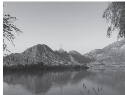
图 2 下川村水车周边景观