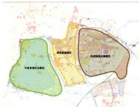
图3 高新技术开发区功能分区规划图