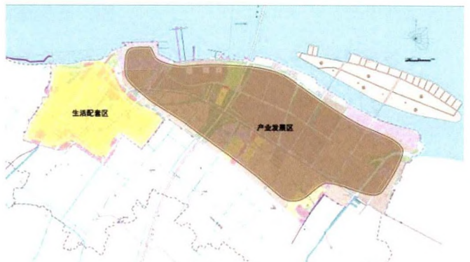
图4 经济技术开发区功能分区规划图