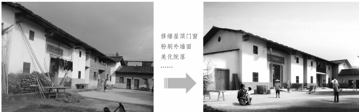
图2 现状民居修缮前与修缮后对比

梳理现状建筑,对传统赣南民居进行维护、修缮,维持其原有风貌(图2);对于传统风貌不协调的建筑进行整治、改造,增加门楣、楹联等客家元素,粉刷里面等等,使建筑改造后风貌与传统建筑相统