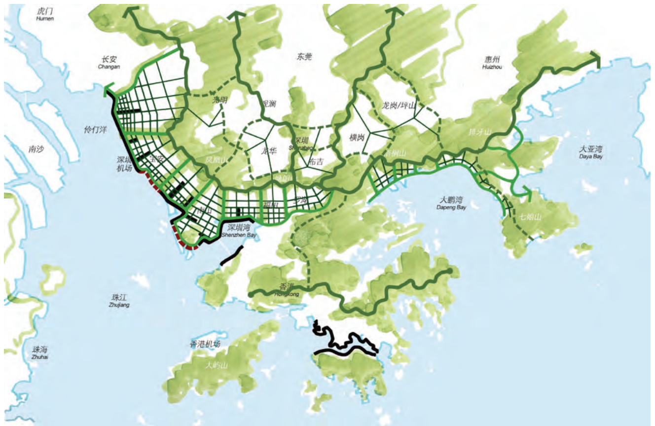
图2 公共空间系统连接示意图